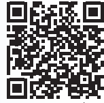
Scan QR Code to RSVP

Water Tag将激光枪战的刺激与水战的清凉完美结合。准备好把对手淋个透, 赢得胜利吧! 需提前预约, 扫描二维码即可报名。